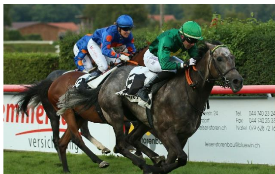
FOUR ROOMS gewinnt für den Stall Wehntal das grosse Flachrennen