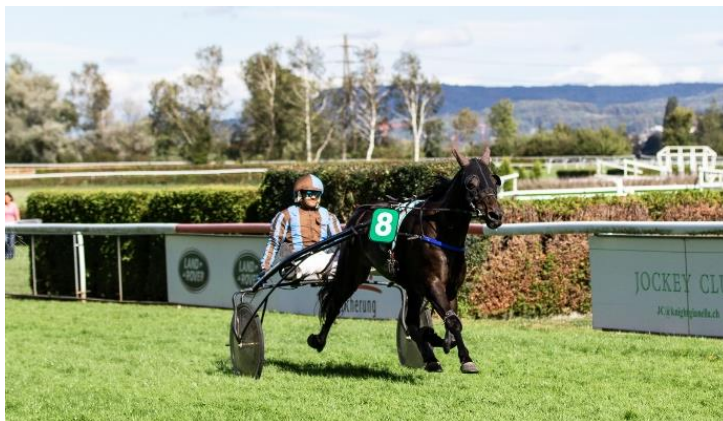
CANONE DU BOCAGE gewinnt den Preis der SIX für den Stall Allegra Racing Club