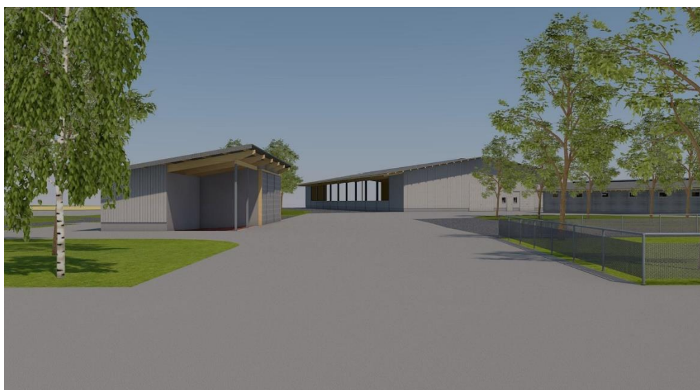
Ansicht auf die 2. Bauetappe

Wie geplant konnte die 2. Bauetappe zum Jahresende abgeschlossen werden. Schon am Jockey Club Renntag wurden die grosszügigen 40 Gastboxen, die grossen Anklang fanden, bezogen.