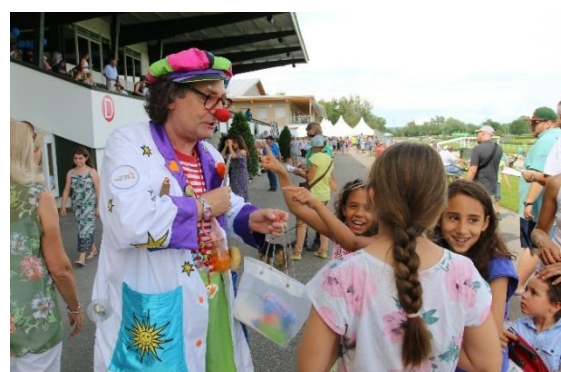
Viele glückliche Kindergesichter