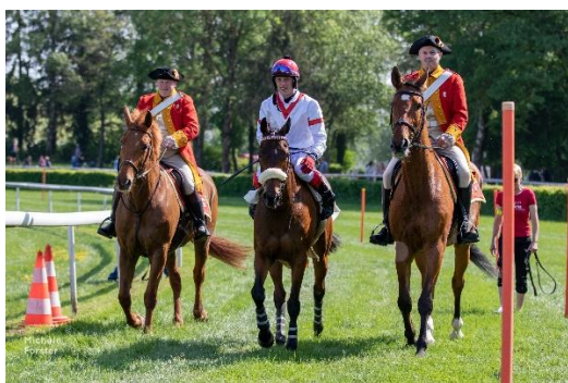
Zünfter beim Abholen des Siegers im „Grossen Preis der Stadt Zürich“

Bei schönstem Frühlingswetter, 8000 Zuschauern, einem neuen Verpflegungskonzept, dem guten Zustand der Bahn, der von der Rennleitung ausdrücklich gelobt wurde, waren alle Voraussetzungen für einen erfolgreichen Zürcher Renntag, der wiederum durch die Zürcher Knabenmusik und die Brass Band Zürich umrahmt wurde, gegeben. Leider rutschten in den beiden ersten Rennen eingangs des Zielbogens zwei Pferde weg. Aus Sicherheitsgründen wurde das zweite Rennen abgebrochen. In der Folge wurde die Situation von der Rennleitung und dem OK analysiert. Nach Rücksprache mit den aktiven Reitern und Trainern wurde die fragliche Stelle ausgesteckt und der Renntag unter sog. erschwerten Bedingungen fortgesetzt. Das Publikum verstand und unterstützte den Entscheid und durfte schlussendlich spannende Rennen mit spektakulären Einläufen erleben.