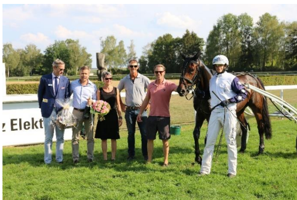
Im Eröffnungsfahren kam EASYPEASY RYTHM für die Ecurie Max Gordon zum erwarteten Erfolg