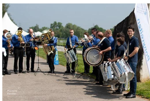
Spiel der Brass Band & Knabenmusik der Stadt Zürich

Die Zünfter sowie die Knabenmusik der Stadt Zürich gaben dem «Zürcher Renntag» zum zweiten Mal eine unverkennbare Note, ganz im Sinne des Rennvereins.