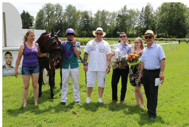
FAST AND FURIOUS gewinnt vor AMOUR D'ETE das Eröffnungstrabfahren im Preis der Armin Hunziker AG

Zusammengefasst zog unser OK Chef Reto Vanoli zum Abschluss folgende Bilanz: