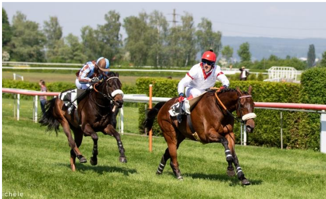
BLINGLESS verteidigt im GP der Stadt Zürich seinen Titel erfolgreich

Auch sportlich durften die Zuschauer einen Höhepunkt nach dem anderen erleben: