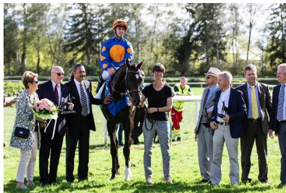
BIMINI TWIST gewinnt ebenfalls unter Fabrice Veron das 37. St. Leger von der Spitze aus

Mit weiteren 5 Galopprennen und 2 Trabfahren durften die Zuschauer spannende Einläufe erleben: