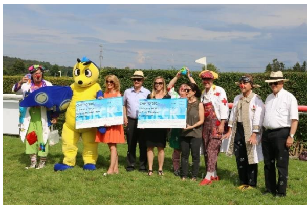
Checkübergabe an die Stiftungen

Dank der Tombola und zusätzlichen Spenden konnten den beiden Stiftungen Wunderlampe und Theodora, die sich beide für schwer kranke, behinderte Kinder einsetzen und somit für unvergessliche Momente des Glücks sorgen, je ein Check über CHF 10'000 überreichen.