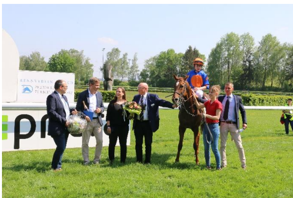
LE COLONEL gewinnt den «GP des Rennvereins Zürich»