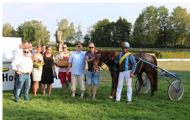
TILLEUL D'ANJOU wiederholt für den Stall Allegra seinen Vorjahressieg