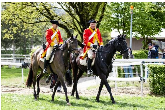
Zünfter beim „Grossen Preis der Stadt Zürich“

Während am Sonntagmorgen verschiedene Regionen der Schweiz noch schneebedeckt waren, blieb das Zürcher Unterland glücklicherweise davon verschont, dies trotz zeitweise bitterkaltem Wetter. Rund 4800 Zuschauer fanden trotzdem den Weg auf die Parkrennbahn, was unter diesen Umständen als Erfolg gewertet werden darf. Sie wurden nicht enttäuscht und durften bei hervorragendem Zustand des Geläufes grossen und spannenden Sport miterleben. Dass ein Teil der Tribüne für das Publikum ohne Aufpreis geöffnet wurde, erwies sich als richtig. Auch wusste die Compass Group als neuer Caterer sowohl im VIP – wie auch im Public Bereich zu überzeugen. Entsprechend dem Tagesmotto gaben die Zünfter Reiter beim Begleiten des Siegers des «Grossen Preis der Stadt Zürich» sowie die Knabenmusik der Stadt Zürich dem «Zürcher Renntag» wiederum die gewünschte unverkennbare Note.