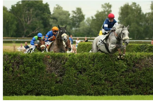
Und wieder hiess der Sieger BARAKA DE THAIX für die Fam. Schmid im abschliessenden Jagdrennen «Preis der P. Baumgartner AG und der Alurex Kindt AG»

Zusammengefasst zog unser OK Chef Reto Vanoli zum Abschluss folgende Bilanz: «Unser Renntag war sehr breit gefächert. Von den strahlenden Kinderaugen, über hochstehenden Rennsport, mit teilweise Hitchcock Finale, bis zu den Partygästen, die zum Abschluss auch nach 22.00 Uhr nicht von den Tischen runter wollten. Ein solcher Renntag macht richtig Spass!»