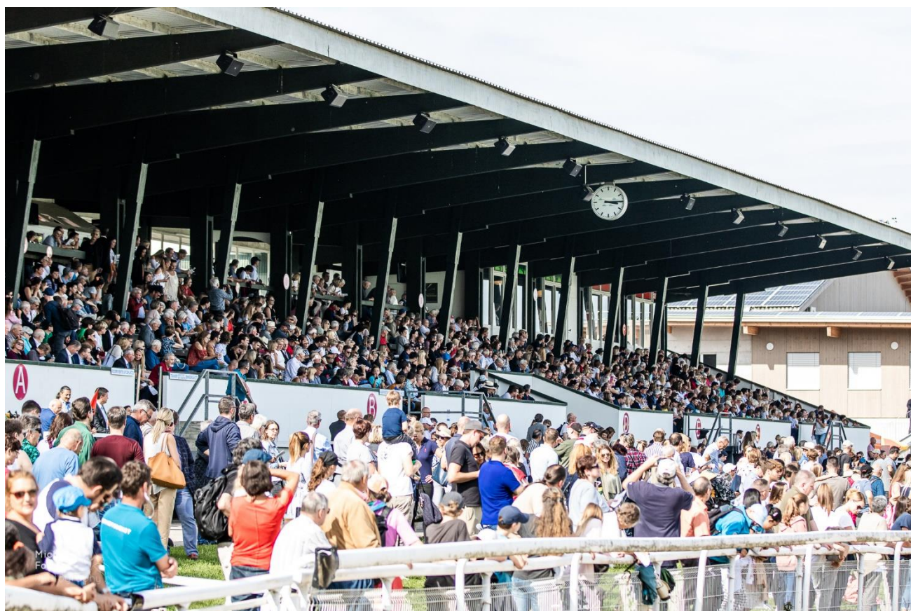
Land Rover - Jockey Club Renntag vom 22.09.2019 - Tribüne voll besetzt, wie schon lange nicht mehr

Im abgelaufenen Jahr waren wir bestrebt unseren Mitgliedern und Zuschauern mit hochstehendem Sport in ausserordentlichem Ambiente auf unserer Parkrennbahn Freude zu bereiten. Dies ist uns mit den drei vorgesehenen Renntagen gelungen. So sind die Zuschauerzahlen stetig angestiegen und der Rennverein Zürich wird wieder als unverzichtbarer Begegnungsort des Pferderennsportes wahrgenommen. Besonderen Zuspruch fanden dabei einerseits die Neuerung, die Tribüne teilweise für alle Besucher zu öffnen, andererseits die neue Zusammenarbeit mit der Compass Group für das Catering des VIP, wie des Public Bereiches, die positiv aufgenommen wurden.