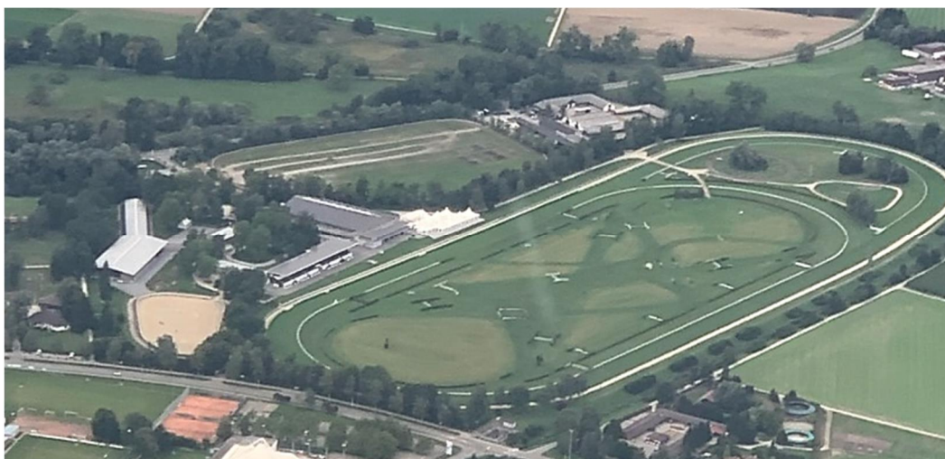
Luftaufnahme Horse Park Zürich-Dielsdorf – polysportives Pferdezentrum

Der bereits 2013 eingeleitete Umbau und die komplette Erneuerung des Horse Parkes konnte zu Jahresbeginn mit der Begleichung der Endabrechnung abgeschlossen werden. Damit sind die Voraussetzungen gegeben, die Parkrennbahn mit angeschlossener Trainingszentrale als multifunktionale Pferdesportanlage erfolgreich für die kommenden Jahre zu betreiben und weiter zu entwickeln. Der Horse Park ist somit die einzige offene und neutrale Anlage mit grosser regionaler Ausstrahlung in der Deutschschweiz, die sich mit IENA, seinem Pendant in Avenches in der Romandie, vergleichen lässt und die es ermöglicht Pferdesport mit all seinen vielfältigen Disziplinen zu verwirklichen.