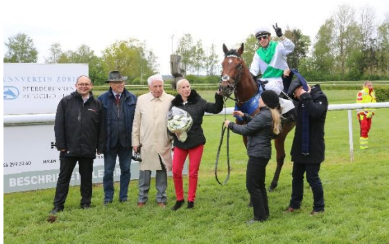
WAI KEY STAR gewinnt für den Stall Salzburg den «GP der Stadt Zürich»

Sportlich durften die Zuschauer einen Höhepunkt nach dem anderen erleben: