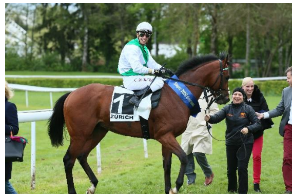
Die «2000 Guineas», das klassische Rennen über die Meile, gewinnt RUNNYMEDE für den Stall Salzburg