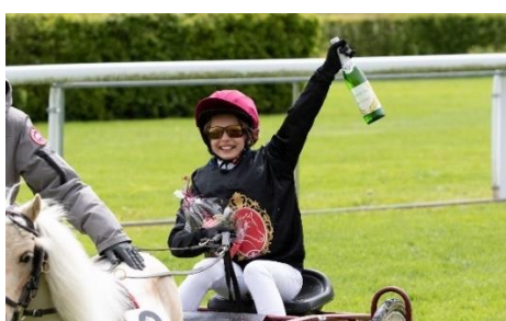
Die Freude ist beim Nachwuchs nicht minder gross!