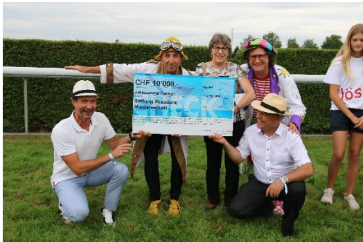
Checkübergabe an die Stiftung Theodora