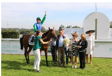
VALROSE gewinnt für den Stall Aventicum den «Jockey Club-Gentlemen's Cup»