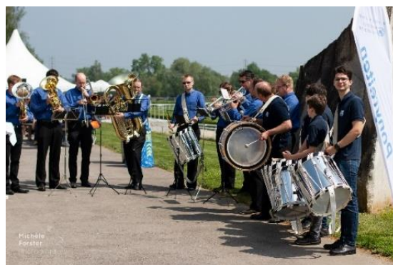
Zürcher Knabenmusik im Einsatz

Neben den offiziellen Pferderennen kam es im Macht Race zum ungleichen Kampf zwischen Mensch und Tier, das Franco Marvulli unerwartet für sich entschied.