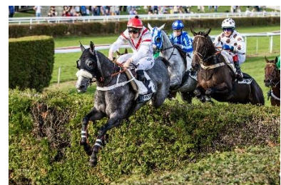
Das Jagdrennen «Next Generation» gewinnt CONTRE TOUS für den Stall Rossriet (weiss mit br. Punkten)