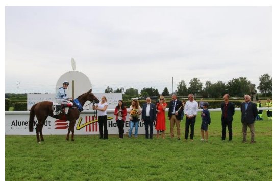
HIGH HOPE im Besitze des Stalles Miracle gewann das «Stutenderby» von der Spitze aus