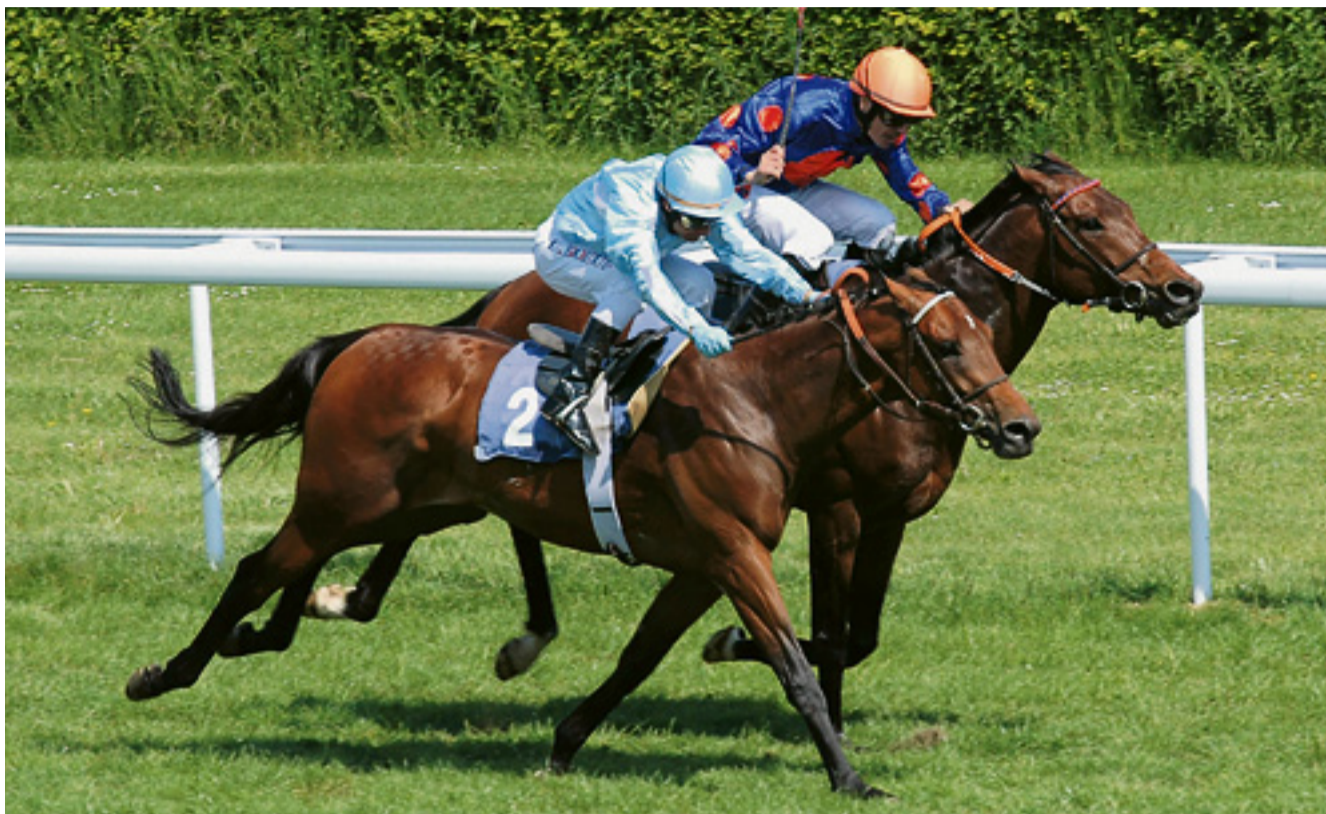
Nightdance Paolo (Nummer 2) und Pont des Arts lieferten sich auf der Parkrennbahn Dielsdorf schon viele packende Duelle.

Im Stall auf dem Pferdesportzentrum in Dielsdorf sind die beiden Cracks durch zwei Abteile getrennt. Plaketten mit dem Hinweis «Das beste Pferd im Stall» und «Pferd des Jahres 2009» zieren den Eingang zur Boxe von Pont des Arts. Mit zwei Siegen bei sieben Starts bewies der Hengst im Besitz des Ehepaars Kräulinger in diesem Jahr sein enormes Galoppiervermögen. Dabei musste der Fronrunner sich schon