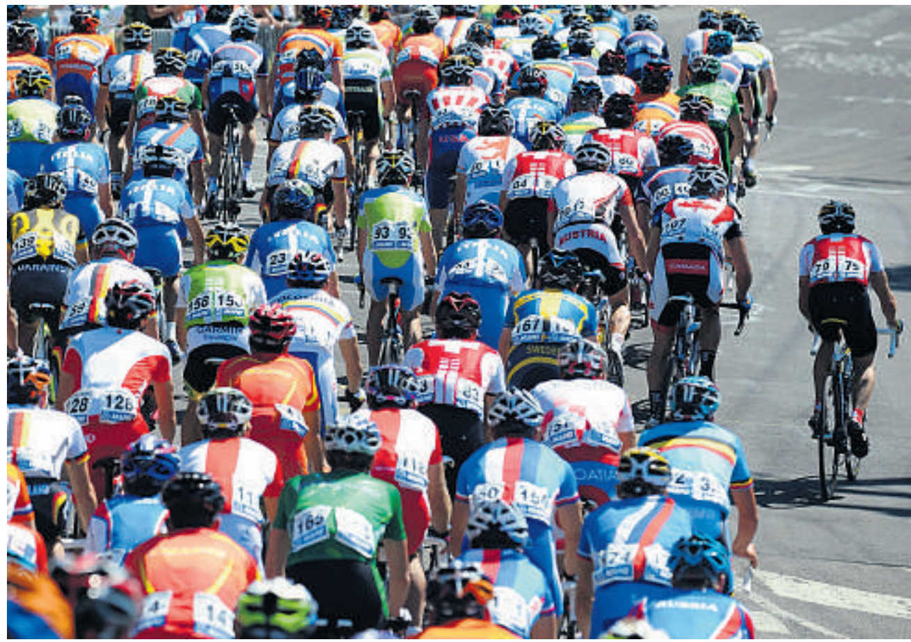
Unmittelbar nach dem Start ist noch offen, ob der Titel nach einem Sprint vergeben wird. Neueste Prognose: eher nein.

Cancellara ist die Distanz dennoch nicht lang genug. «Die Strecke ist 20 Kilometer zu kurz, damit die Topsprinter von den anderen richtig müde gefahren werden könnten», sagt er. Den Sprintern die Kraft zu rauben und sie von ihren Mannschaftskollegen zu isolieren, um im Finale vielleicht selber eine entscheidende Attacke zu setzen –